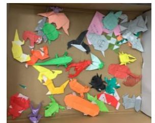
素敵な景品のたくさんありました。折り紙の作品です