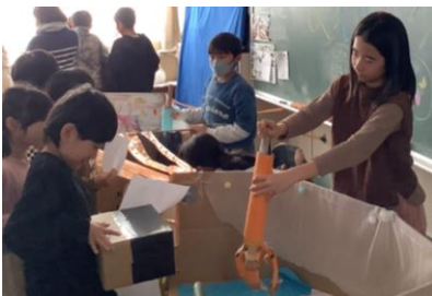
手作り UFO キャッチャーを動かしています。

今年、延期することなく「今小フェスティバル」を実施することができました。全部で16のお店が开店し、どこのお店でも、やさしくお客さんに対応する姿、お店の説明をしっかりと聞き、楽しむ姿が見られました。見学に行くと、行くお店行くお店で、子どもたちの素晴らしいアイデア、手作りの技術の高さにびっくりし、「素晴らしい。」と思わず感嘆の声がでていました。この活動をとおり、クラスの友達と協力して一つのことを成し遂げる力、人と関わることの楽しさを感じてくれたことと思います。子どもたちの素敵な笑顔があふれた活動となりました。