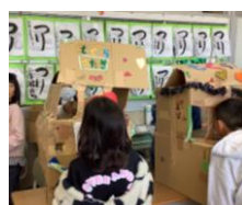
もぐらたたき 前にとびだしてきます。