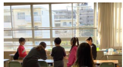
集中して、射的に挑戦中!