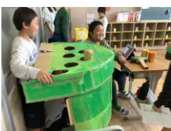
もぐらたたき きれいに緑色であげていました。