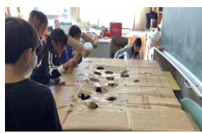
もぐらたたき たくさんの穴からモグラがでてきます。