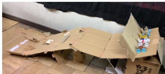
ペットボトルキャップを利用して作った馬が、コースを滑り降りる仕組みです。「いけー!」という声が響いていました。