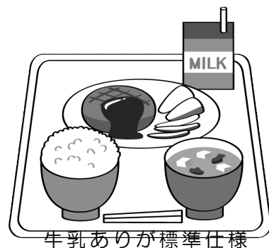
牛乳ありが標準仕様 となっています。

また、アレルギーなどの理由で牛乳の飲用を希望されない場 合は「牛乳等飲用停止届出書」を提出する必要があります。必 ず届出書を中学校か、教育委員会学務課給食準備担当に提出 してください。届出書を提出して数日後にログインページ内にて 「牛乳なし・給食のみ」の注文が可能となりますので、ご確認ください。