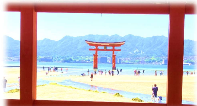
(うえの写真は厳島神社の鳥居です)

しゅっぱつとうじつ つじどうえきしゅうごう ぜんたい じかん い 出発当日の辻堂駅集合から全体の時間を意 識した行動ができていて、それが修学旅行全体 を通して貫かれていたのは「さすが最上級生！」 と思わせる姿でした。