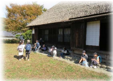
3年生 茅ヶ崎市博物館