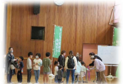
11月26日 子どもまつり

11月26日室田小体育館にて推進協議会の方々が主催し、実行委員の子どもたちが中心となり、3年ぶりに子どもまつりが開催されました。皆とても楽しそうに活動していました。