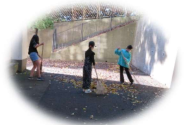
6年生の自主的活動 落ち葉の掃除

令和4年も残り1か月。保護者、地域の皆様には日頃からご協力をいただき、大変感謝しております。先日は様々な制限のある中、授業参観に多数ご参加いただき、ありがとうございました。12月は、個別面談が予定されています。引き続きご理解、ご協力のほどよろしくお願いいたします。