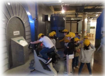
1年生 湘南台文化センター