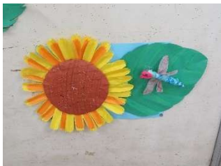
松の実児童の作品

9月21日(水)に1・2年生、松の実教室で赤羽根青少年広場に虫とりに行きました。子どもたちは虫とり網を振りまわしトンボを追いかけて、草むらをかき分けバッタやコオロギを見つけていました。何人かの子どもが、コオロギが肉食であることや、バッタにはいろいろな種類があることなどを教えてくれました。知識が豊富なことに感心しました。楽しげな様子にこちらもうれしくなりました。