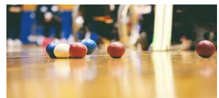
ボッチャはこんなボールを使っています 一つ一つかなりの重さがあります。

定員があるので、全員が希望のクラブに入れるとはいきませんし、一年間のクラブの回数も限られています。わずかな時間でも、クラブを通して好きなことに夢中になり、大いに楽しめる時間を過ごしてほしいと思います。そして、その活動の中で、異学年の仲間とも交流し、様々ななかかわり方も学んでほしいと思います。