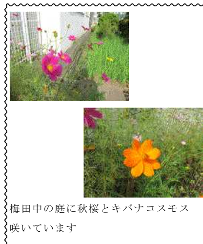
梅田中の庭に秋桜とキバナコスモス 咲いています