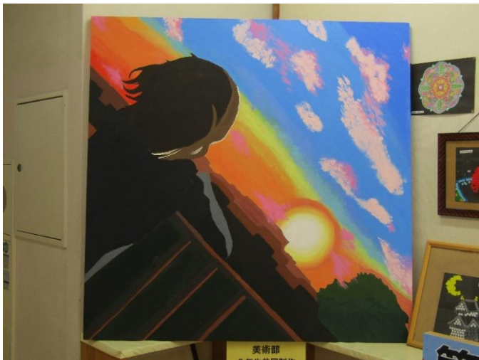
「美術部の共同制作作品」