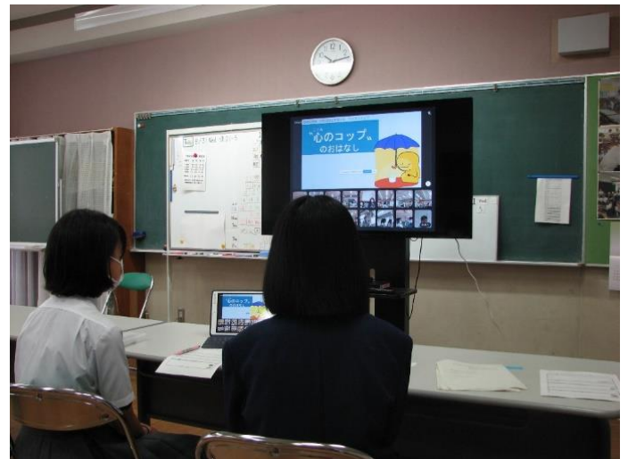
「茅ヶ崎市いじめ防止サミットの様子」