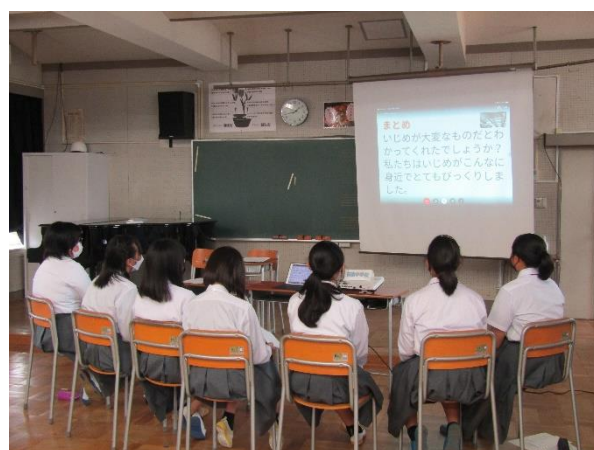
「いじめ防止サミットの様子」