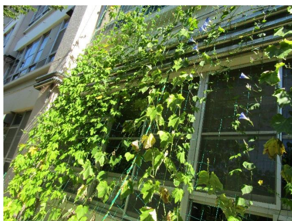
「大きく伸びたグリーンカーテン」