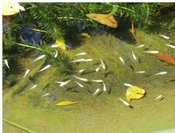
「ビオトープの蓮の花と元気に泳ぐメダカたち」