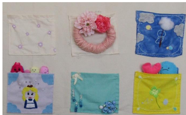
「美術部・手芸部の校内展示作品の一部」