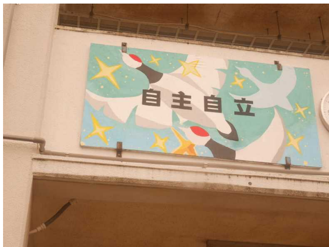
(生徒会スローガンを美術部3年生が制作した作品です)

前代未聞のコロナ禍という逆境の中で「ゴールデンエイジ」を迎える生徒ですが、苦しい時期でこそ、生徒が学ぶべきことはたくさんあると思います。生徒一人ひとりには逆境の中でも自分自身をしっかりと見据え、コロナ禍を生き抜いてもらいたいと思います。