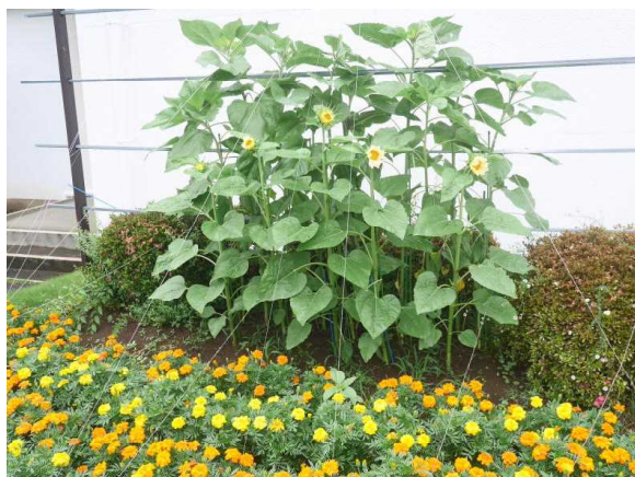
(体育館前に今年もヒマワリが咲きました)

これからの3年間は保護者の皆様からは経済的な支援(交通費や道具類の購入など)をはじめ、日頃の洗濯、お弁当の準備など、数多くの支援が必要となります。ぜひとも本校の部活動にご理解、ご協力をお願いします。