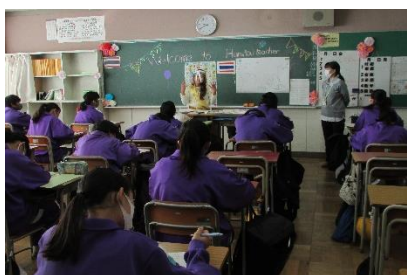
1年国際理解教室タイコースの様子