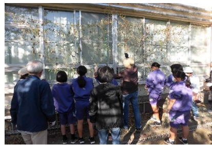
生徒会とボランティアの緑のカーテン撤去作業