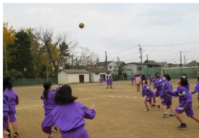
2年ドッジボールの様子