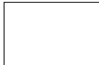
推進協ボランティア協力