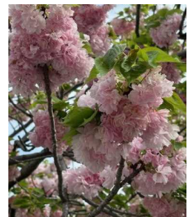
今年も西門の八重桜が 綺麗に咲きました。