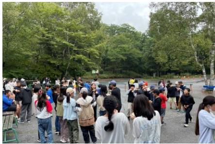
青空も見られた光徳牧場 アイスも美味しい