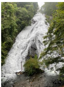
水量が多かった 湯滝

実行委員の挨拶や声かけにすぐに反応し、聞く体制をつくる子どもたちの姿、食事を楽しくいただく姿、見学中の目の輝き、お土産選びに何度も迷う姿、廊下に漏れ聞こえる部屋での時間を楽しむ声、消灯時間後にドアが開かれ「やばい」という声とともに急いで部屋に戻る姿。どの姿にも、子どもたちがこの2日間を大切な時間として過ごしていることが伝わってきました。帰りの電車も楽しく過ごし、あと30分で到着というところで寝に入ってしまうなど、ぎりぎりまで楽しんだとともに、今宿小学校の顔として、公共の場で待つ、列になって歩くなどの様々な振る舞いにおいても、最上級生らしさを発揮してくれました。