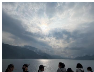
遊覧船 景色の美しさに興奮しました