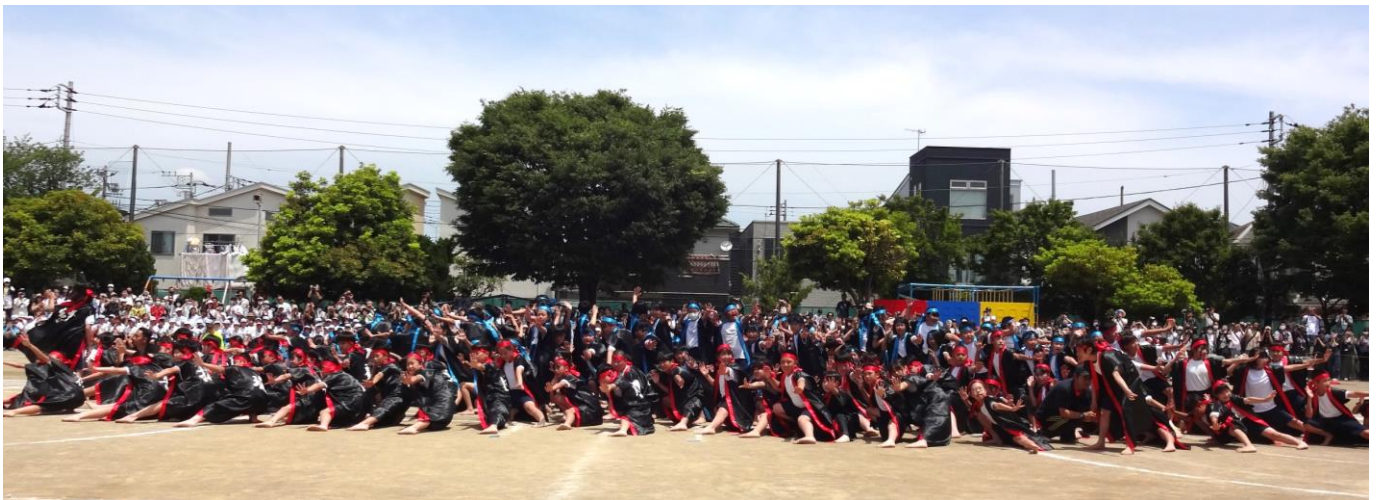
5年生、6年生 ソーラン節 最後の「ヤー！」の声とともに大きな拍手が沸き起こりました。

また、今年度は地域の方々にも子どもたちの姿を見ていただくことができ、教職員一同、地域の温かさを実感できる時間となりました。手をつなぐ会の方々にも、前日からご準備いただき、そして当日の後片付けへのお手伝いもいただき、皆様に支えられていることの心強さを改めて感じるすることができました。本当に、ありがとうございました。