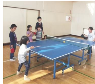
体育館プラザの風景 パートナーが見守り卓球を楽しむ