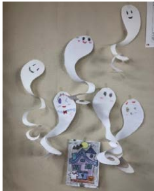
↑画用紙をグルグル切って、キュートなお化けの出来上がり！