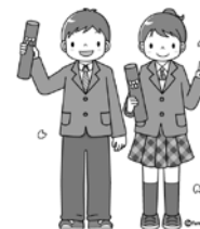
パートナー一同より

いつもプラザに遊びに来てくれてありがとう！ ご卒業、ご進級おめでとうございます。