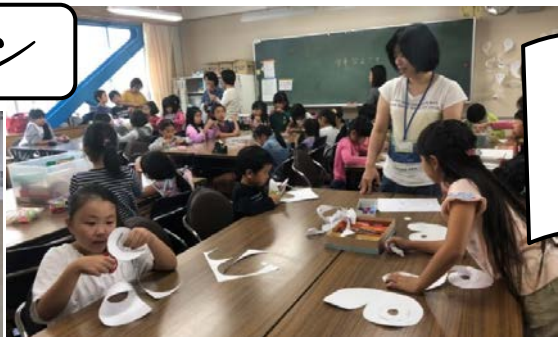
懇談会の日、たくさん子どもたちで大盛況