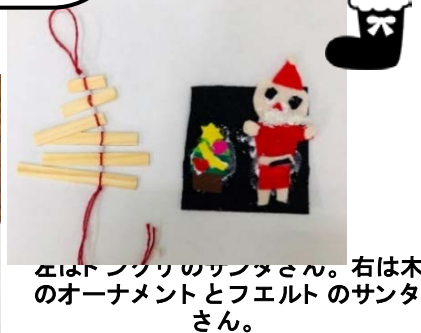
左はドングリのサンタさん。右は木のオーナメントとフェルトのサンタさん。